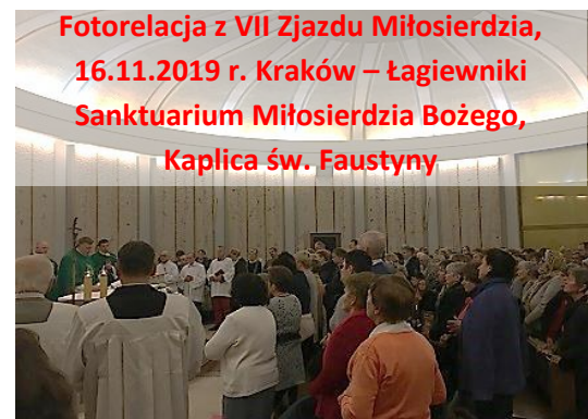
Fotorelacja z VII Zjazdu Miłosierdzia, 16.11.2019 r. Kraków – Łagiewniki Sanktuarium Miłosierdzia Bożego, Kaplica św. Faustyny